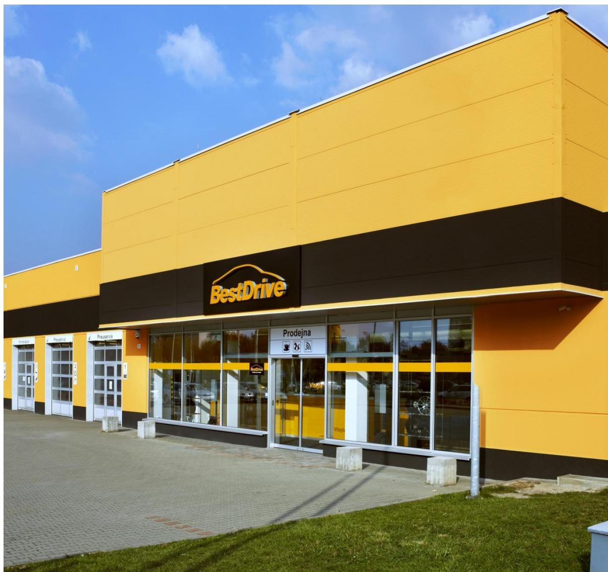
Obr. 2 – Pobočka BestDrive v Ostravě

servisních stáních v Ostravě a Plzni, 6 servisních stání v Praze) – zcela určitě přispěje k dalšímu zvýšení komfortu i spokojenosti našich zákazníků.