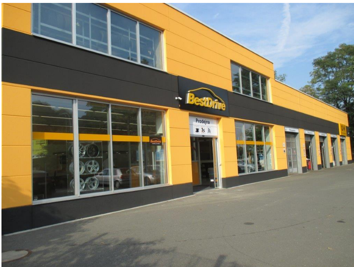
Obr. 1 - Pobočka Praha – Košíře v novém.

V průběhu následujících měsíců panoval na všech třech pobočkách čilý stavební ruch. Značka BestDrive není jen o logu na budově, pro servisy to znamenalo kompletní rekonstrukci prostor, tak, aby odpovídala standardům servisní sítě BestDrive.